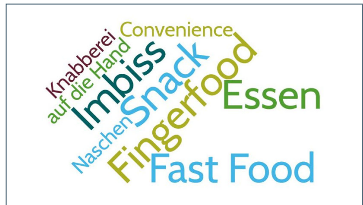
Abb. 1: Begriffsassoziationen zum Snack (eigene Darstellung)

Ideal wäre eine einheitliche Definition. Das gestaltet sich jedoch schwierig, denn in der Fachliteratur werden Snacks durch unterschiedliche Charakteristika beschrieben: Diese beziehen sich u. a. auf Nährstoffprofil, Energiemenge, Verzehrszeitpunkt, Lebensmittelgruppe oder Verzehrshäufigkeit. Zudem widersprechen oder ergänzen sich die Definitionen je nach Bezug. So stimmen ernährungsphysiologische Vorstel-